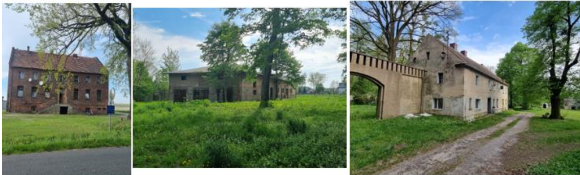
Fotografia 15. Widok na gorzelnię, wozownię oraz dom zarządcy w założeniu pałacowo – parkowym.

bryły – piętrowa z użytkowym poddaszem, nakryta stromym dachem dwuspadowym z dwoma symetrycznymi facjatami w połaci wschodniej. Boczne części pałacu: północna i południowa znacznie wyższe od środkowej, dwupiętrowe, z bardzo wysokimi poddaszami strychowymi, nakryte stromymi dachami czterospadowymi.