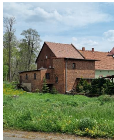
Fotografia 17. Widok na młyn w miejscowości Tuły.

Na terenie miejscowości Tuły znajduje się zagroda młynarska, w skład której wchodzi: młyn, dom młynarza, stodoła oraz dwie obory.