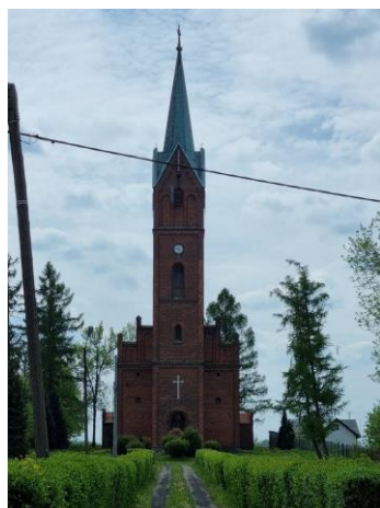
Fotografia 9. Widok na kościół ewangelicki w Lasowicach Wielkich.