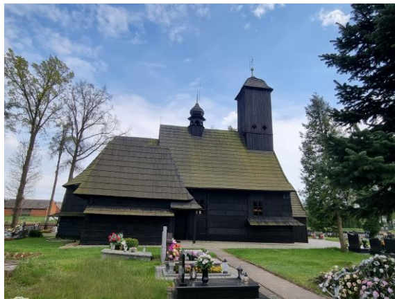
Fotografia 5. Widok na Kościół filialny pw. św. Jana Chrzciciela w Wędryni.

Pierwsza wzmianka o katolickiej świątyni w Wędryni pojawia się w źródłach w 1447 r., obecny kościół został wzniesiony na przełomie XVII i XVIII w. (Herbert Dienwiebel podaje daty 1679-1719). Wieża powstała w 1818 roku. Na północnej, murowanej bramie wjazdowej widnieje data „1861”, oznaczająca rok jej budowy lub datę remontu kościoła (budowę zachodniej kruchty?). W roku 1959 wykonano podmurówkę sięgającą ok. 50 cm