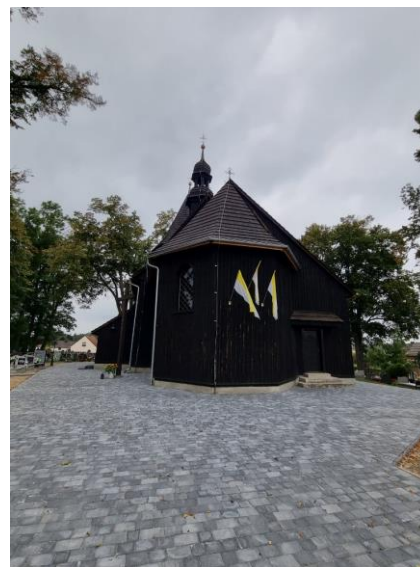
Fotografia 1. Widok na kościół św. Wawrzyńca w Laskowicach.

Kościół jest objęty ochroną poprzez wpis do Rejestru Zabytków Województwa Opolskiego.