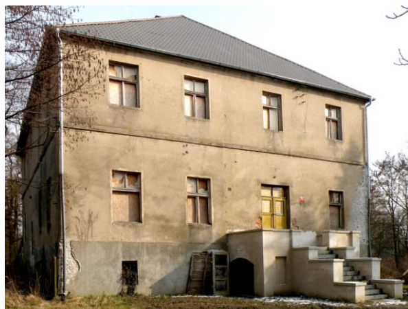
Fotografia 10. Widok na dwór w Lasowicach Małych.

Dwór znajduje się w środkowej części założenia dworsko – parkowego.