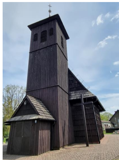
Fotografia 6. Widok na Kościół pw. Wszystkich Świętych w Lasowicach Wielkich.

Kościół w Lasowicach Wielkich istniał już w 1447 roku, była to budowla o konstrukcji drewnianej. W 1519 roku świątynia spłonęła, w jej miejsce został wzniesiony nowy obiekt sakralny. Obecny drewniany kościół parafialny zbudowany został w 1599 roku przez protestantów. W 1701 roku świątynię przejęli katolicy (należała ona wówczas do parafii w Bogacicy. W 1837 roku ustanowiono parafię w Lasowicach Wielkich, a kościół stał się jednocześnie kościołem parafialnym. Na terenie przykościelnym znajduje się również cmentarz. Cały teren otacza drewniane ogrodzenie z bramą główną na osi elewacji zachodniej oraz furtką we wschodniej części ogrodzenia.