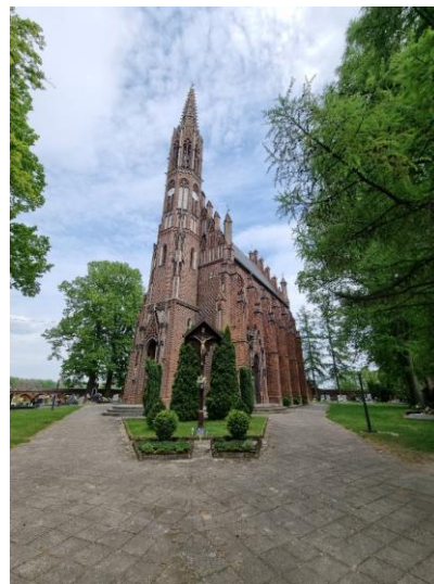
Fotografia 3. Widok na kościół pw. Matki Bolesnej w Tułach.

Kościół jest objęty ochroną poprzez wpis do Rejestru Zabytków Województwa Opolskiego.