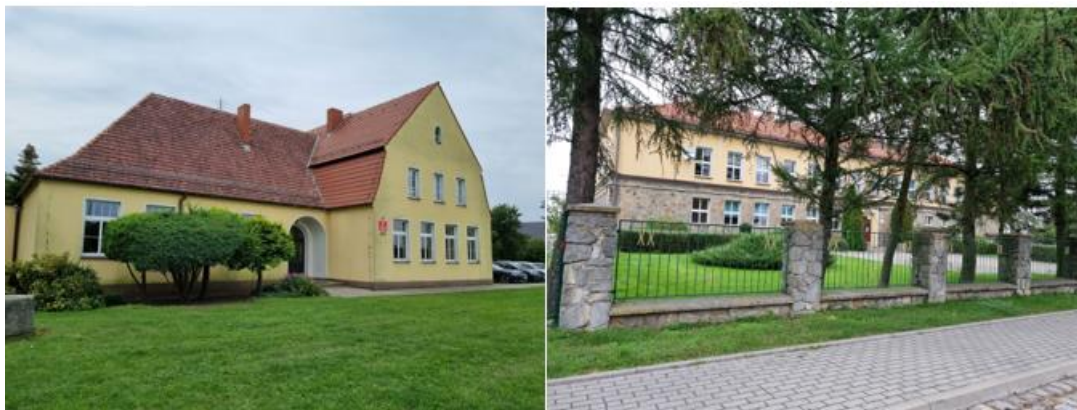
Fotografia 21. Widok na placówki oświatowe w Chudobie i Gronowicach.