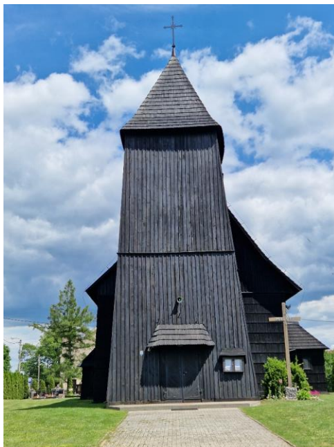
Fotografia 2. Widok na Kościół filialny pw. Wniebowzięcia NMP w Lasowicach Małych.

Kościół jest objęty ochroną poprzez wpis do Rejestru Zabytków Województwa Opolskiego.