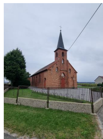
Fotografia 8. Widok na kościół św. Rodziny w Jasieniu.

Kościół jest objęty ochroną poprzez wpis do Wojewódzkiej Ewidencji Zabytków Województwa Opolskiego.