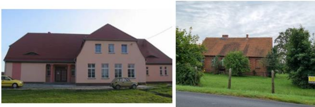
Fotografia 20. Widok na dawne placówki oświatowe – ewangelickie (od lewej szkoła w Lasowicach Małych od prawej w Wędryni).