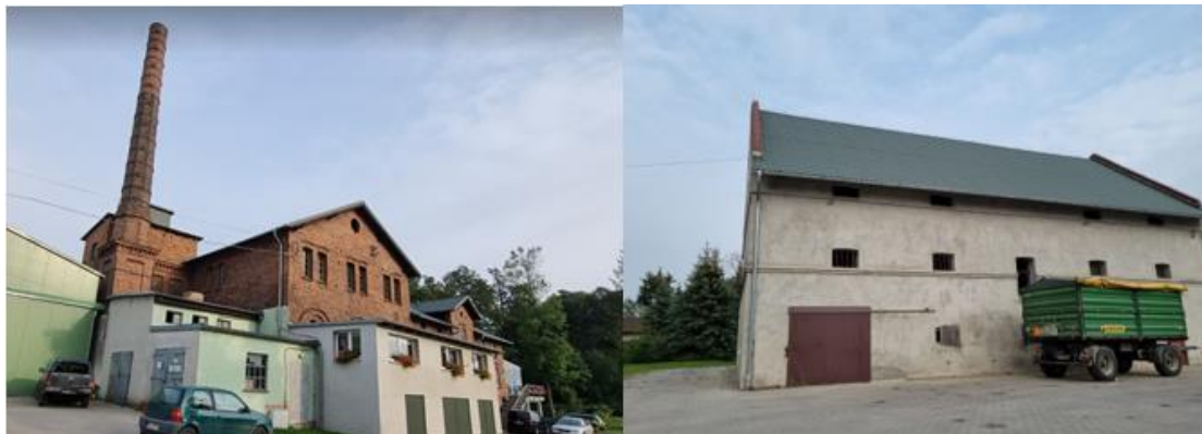
Fotografia 11. Widok na gorzelnie i spichlerz w założeniu dworsko – parkowym.

Zachowana oryginalna stolarka okienna i drzwiowa.