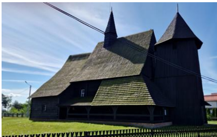
Fotografia 4. Widok na Kościół parafialny pw. Narodzenia NMP w Chocianowicach.

Plan kościoła składa się z wydłużonego, trójkątnie zamkniętego prezbiterium z prostokątną zakrystią przylegającą do niego od północy; szerszej od niego, prostokątnej nawy oraz kwadratowej wieży po stronie zachodniej i niewielkiej kruchty od południa. Dachy nad prezbiterium i nawą są wysokie, siodłowe, o dwóch kalenicach. Północna, przedłużona połączyć dachu nad prezbiterium opadając przykrywa także