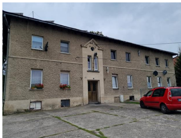
Fotografia 16. Widok na dwór w Jasieniu.

Obiekty są objęte ochroną poprzez wpis do wojewódzkiej ewidencji zabytków województwa łódzkiego.