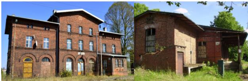
Fotografia 19. Widok na budynek stacji kolejowej w Chudobie oraz w Lasowicach Małych.

Obecnie na terenie gminy nie funkcjonuje kolej pasażerka. Pozostałością po dawnej infrastrukturze kolejowej są m.in. dwa budynki dworca zlokalizowane w miejscowościach Chudoba i Lasowice Małe.