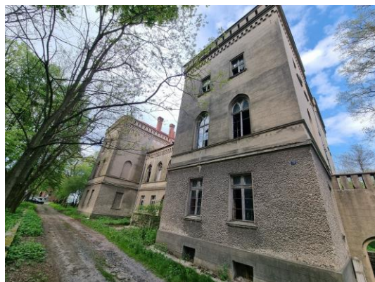
Fotografia 14. Widok na pałac w Wędryni.

Budynek w całości podpiwniczony. Środkowa część