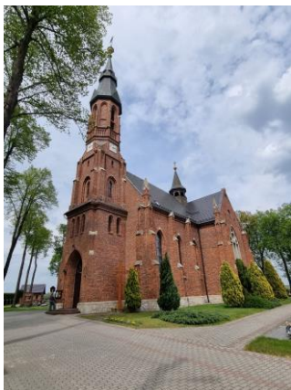
Fotografia 7. Widok na kościół pw. Najświętszego Serca Pana Jezusa w Chudobie.