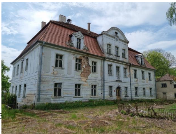
Fotografia 12. Widok na pałac w Tułach.

W jego najbliższym sąsiedztwie znajdują się spichlerz i dwie oficyny, a od pd. park. Pierwotnie na osi pałacu znajdowała się brama, obecnie wjazd przeniesiono do pn.-zach. narożnika założenia.