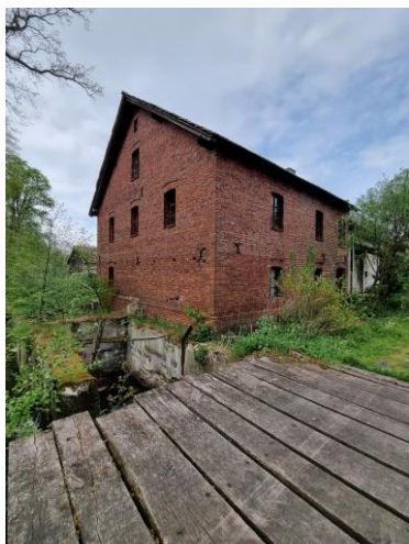
Fotografia 18. Widok na młyn w miejscowości Szumirad.

Stan zachowania obiektów w zagrodzie młynarskiej – dobry.