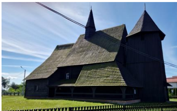
Fotografia 4. Widok na Kościół parafialny pw. Narodzenia NMP w Chocianowicach.

Plan kościoła składa się z wydłużonego, trójkątnie zamkniętego prezbiterium z prostokątną zakrystią przylegającą do niego od północy; szerszej od niego, prostokątnej nawy oraz kwadratowej wieży po stronie zachodniej i niewielkiej kruchty od południa. Dachy nad prezbiterium i nawą są wysokie, siodłowe, o dwóch kalenicach. Północna, przedłużona połączyć dachu nad prezbiterium opadając przykrywa także zakrystię. Przy północno - zachodniej części kościoła, wzdłuż nawy i częściowo przy wieży, znajdują się wsparte na słupach soboty, których zadaszenie od strony wschodniej sięga do dolnej krawędzi okien, a po stronie zachodniej - do wysokości okapu dachu nawy. Przysadzista wieża o lekko pochyłych ścianach jest w górnej części odsunięta od szczytu nawy, i nakryta ośmiobocznym dachem namiotowym, którego szczyt nieznacznie przewyższa kalenicę dachu.