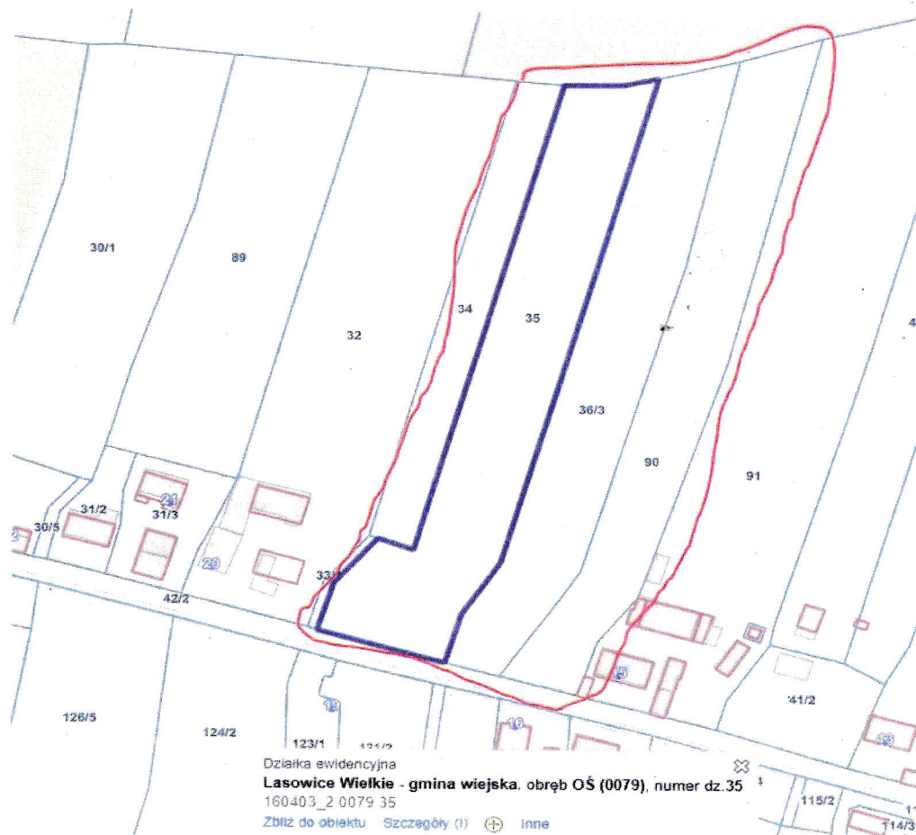
Rys. 1 lokalizacja działek objętych wnioskiem