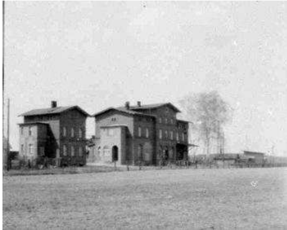
Budynki stacji kolejowej