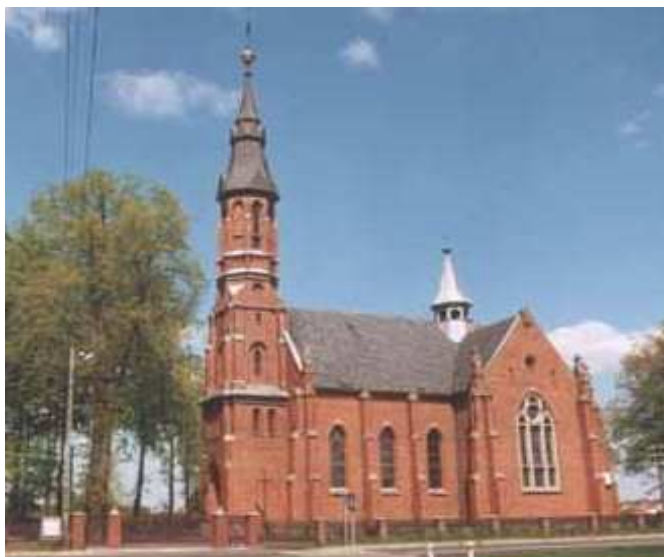
Kościół pod wezwaniem Najświętszego Serca Pana Jezusa w Chudobie (od 1907r.)

Do kościoła należy duży cmentarz, który znajduje się przy kościele oraz znajdująca się w głębi kaplica.