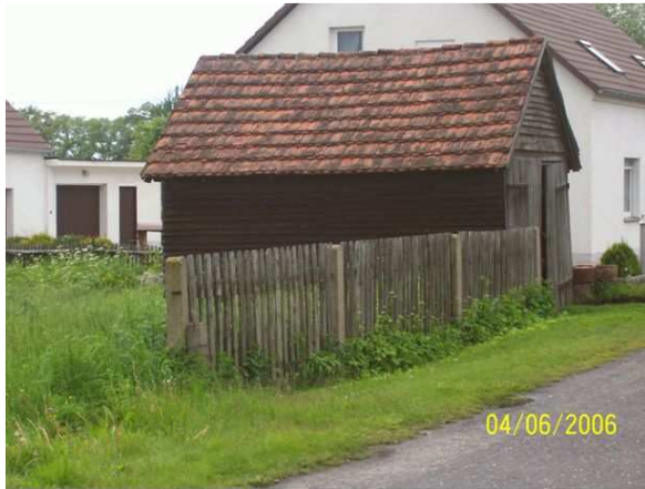
Pierwsza remiza stoi do dziś...