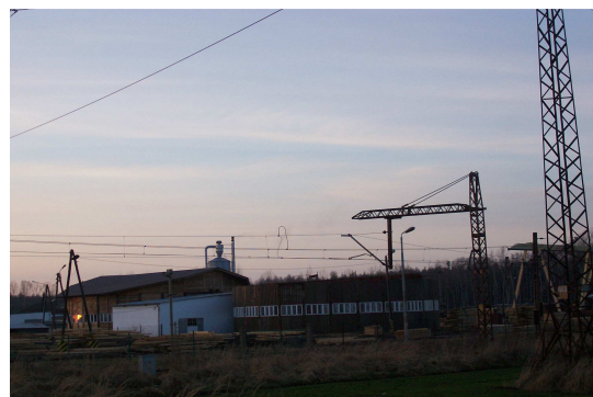
Tartak - zdjęcie z roku 2008