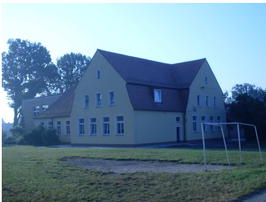
Budynek Szkoły w Chudobie powstał w roku 1857.

W 1917 oddano do użytku nowy budynek szkolny. Został on w 1945 roku spalony przez wkraczające wojska radzieckie. W latach 1967-1968 do istniejącego już budynku szkolnego zostało dobudowane kolejne skrzydło budynku.