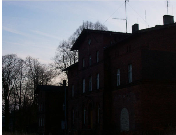
Budynki stacji kolejowej – rok 2008

W budynkach kolejowych w 1905 roku mieszkały 42 osoby. Wszystkie trzy budynki kolejowe istnieją do dzisiaj.