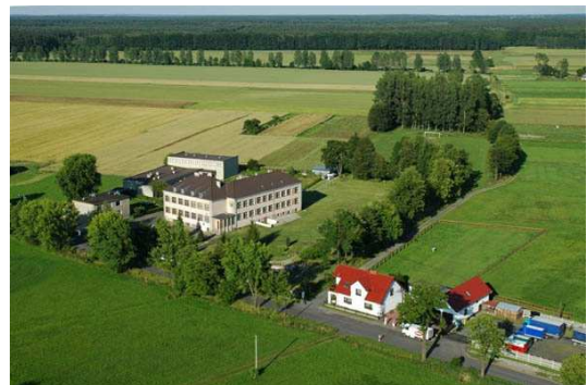
Zdj. nr 12 Zespół Gimnazjalno-Szkolno-Przedszkolny

W Lasowicach Wielkich przy Zespole Gimnazjalno – Szkolno – Przedszkolnym zlokalizowana jest ogólnodostępna Biblioteka Publiczna, w której dostępne są 3 stanowiska komputerowe. W szkole znajduje się również tzw. Klub młodzieżowy, w jednym z pomieszczeń znajdują się 3 stanowiska komputerowe z dostępem do Internetu dla młodzieży szkolnej oraz 1 stanowisko dla nauczyciela. Na terenie Lasowic Wielkich nie ma domu kultury, istnieje natomiast sala spotkań dostosowana do funkcji szkoleniowo-edukacyjnych. W salce odbywają się różne imprezy okolicznościowe, zabawy dla najmłodszych oraz zebrania mieszkańców.