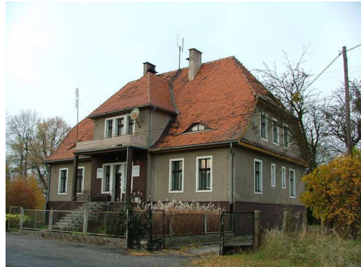
Zdj. nr 6 Niepubliczny Zakład Opieki Zdrowotnej dawna plebania ewangelicka

4. Plebania ewangelicka datowana na lata 20 XX wieku wpisana do Gminnej Ewidencji Zabytków pod numerem 73/1295 pełniła funkcje jako Ośrodek Zdrowia w latach 1900- 01.2009 oraz dom mieszkalny. Ochronie podlega bryła obiektu z charakterystycznym dachem, krytym dachówką ceramiczną, wielkość i kształt otworów oraz drewniana stolarka okienna.