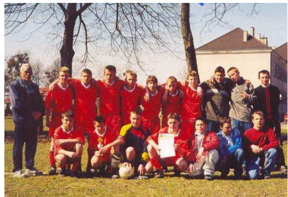
zdz. nr 16 i 17 drużyna LZS dawniej i obecnie