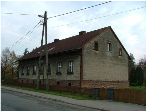
zdj. nr 8 Dom w zespole dworskim z 1903 r