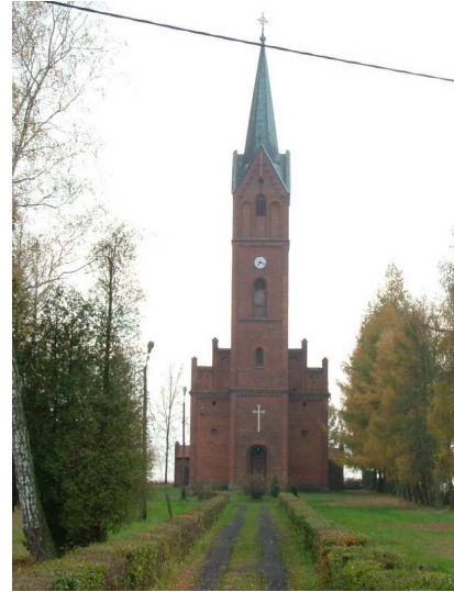
Zdj. nr 5 Kościół Ewangelicki z 1866 r.

Historia kościoła i parafii rozpoczyna się później niż historia wioski. Przepuszczalnym rokiem budowy pierwszego kościoła w Lasowicach Wielkich jest rok 1350. W rejestrze świętopietrza archidiecezji opolskiej z roku 1447 Lasowice Wielkie są wzmiankowane jako parafia. W roku 1519 wymienia się tujejszy kościół parafialny PW. Wszystkich Świętych, który w XVI wieku przejęli protestanci. Nowinki reformatorskie docierają do tych okolic w latach 1520 – 1530. Najprawdopodobniej właściciele wioski – rodzina Dombrowków na kilka lat przed rokiem 1597 przechodzi na protestantyzm. W roku 1597 powstaje parafia katolicka w Bogacicy, do której przyłączono Lasowice Wielkie. Po sprostestantyzowaniu wioski za sprawą właściciela w 1599 roku zbudowano nowy, istniejący do dzisiaj drewniany kościół.