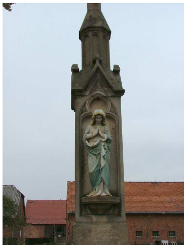
Zdj. nr 3,4 Krzyż na cmentarzu

2.Krzyż na cmentarzu katolickim z 1890r. wpisany do Gminnej Ewidencji Zabytków pod numerem 71/1295. Kamienny krzyż, na szerokim cokole i wysokim postumencie w formie sterczyny. Całość wzbogacona neogotyckim detalem. Nad cokolem napis: Fundatorzy proszą o pobożny Ojciec nasz i Zdrowaś Maria, poniżej data fundacji 1890.Nad napisem - ustawiona na konsoli figura Matki Boskiej. Obiekt należy poddać konserwacji (ubytki kamienia w strefie napisu).