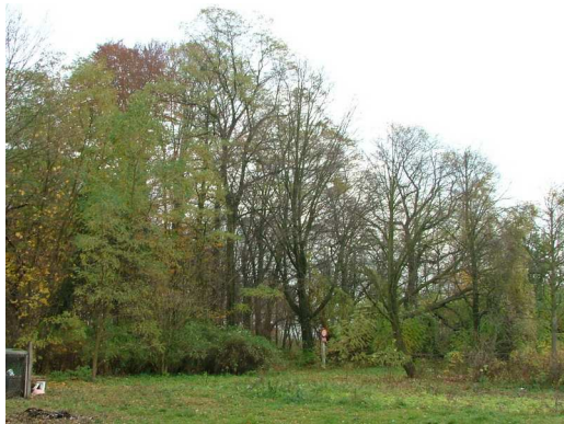
Park krajobrazowy, zachował resztki pierwotnej kompozycji (aleja bukowo-grabowa).

5. Park podworski krajobrazowy wpisany do rejestru zabytków dnia 4 lipca 1986r. pod numerem 141/86 wpisany również do Gminnej Ewidencji Zabytków pod numerem 74/1295 z II połowy XVIII wieku. Wiek najstarszych drzew określono na 250 lat. W parku znajduje się 150 – letnia aleja bukowo –grabowa, lipy i jesiony. Pod koniec XIX wieku posadzono tu: daglezje, świerki, sosny, cyprysy.