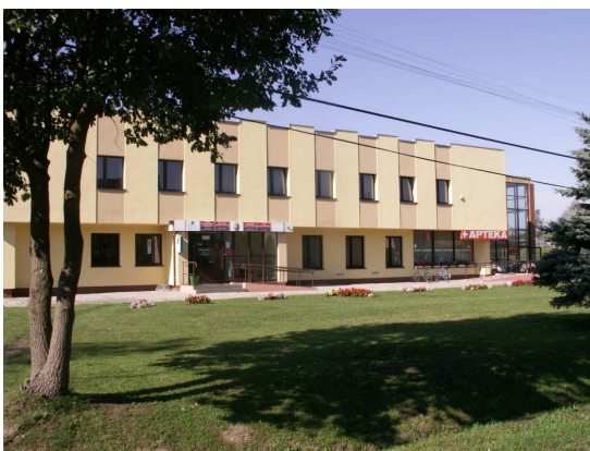
zdj. nr 13 Urząd Gminy Lasowice Wielkie

Zgodnie z Rozporządzeniem Rady Ministrów w sprawie ustalenia granic, zmiany nazw i siedzib władz niektórych gmin i miast oraz nadania miejscowości statusu miasta od dnia 1 stycznia 2006 roku siedziba gminy Lasowice Wielkie znajduje się w Lasowicach Wielkich.