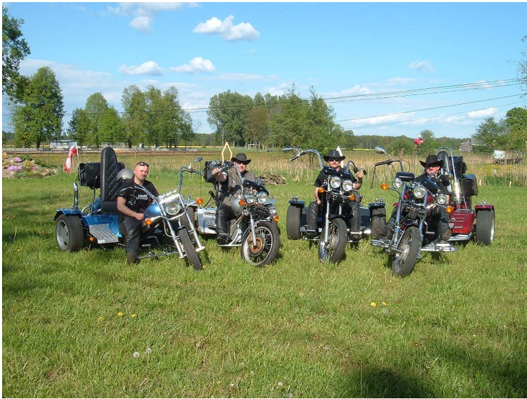
Zdj. nr 15 Motocykle trójkołowe „trajki”