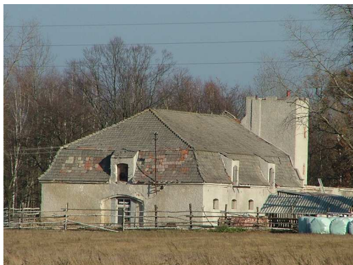
Zdj. nr 10 stodoła przy posesji nr 1