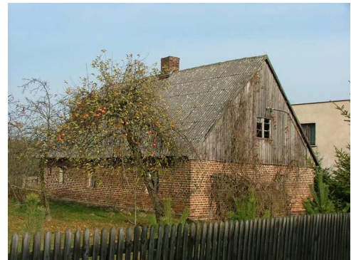
Zdj. nr 11 dom przy posesji nr 131

11. Dom Lasowice Wielkie nr 131 wpisany do rejestru pod numerem 87/1295 z końca XIX wieku.