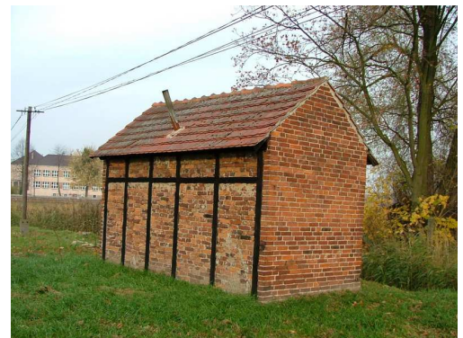
Zdj. nr 9 budynek gospodarczy przy dawnej szkole ewangelickiej