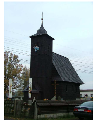
Zdj. nr 2 Kościół parafialny

1.Kościół parafialny PW Wszystkich Świętych – drewniany z 1599r. i murowaną zachrystią z 1905r. Kościół wpisany do Gminnej Ewidencji Zabytków pod numerem 70/1295 wpisany również do rejestru zabytków 30.12.1950 r. nr 19/50