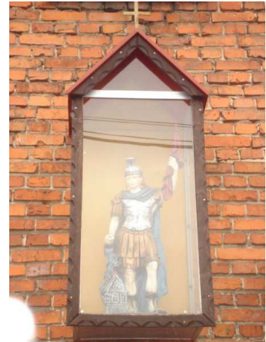
Zdj. nr 15 Św. Floriana przy OSP

W 1958 roku dokładnie 9 marca w sali Prezydium GRN Lasowice Wielkie odbyło się zebranie na którym postanowiono wybudować remizę. Mieszkańcy opaktowali się na ten cel / min. rolnicy po 100 zł od domu i po 15 zł od ha., a pozostali po 50 zł /. Pierwsze prace rozpoczęły się już 11 czerwca w tym samym roku. Już po dwóch latach dokładnie 29 maja 1960 roku remiza została oddana do użytku jako pomnik 1000 lecia istnienia Państwa Polskiego. Wiele osób przyczyniło się do przedsięwzięcia nie sposób ich wszystkich wymienić aby nikogo nie ominąć