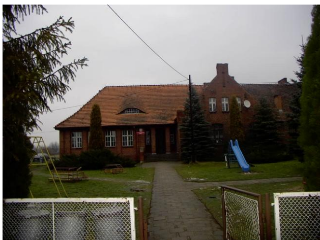
Szkoła w Jasieniu powstała w 1936r.