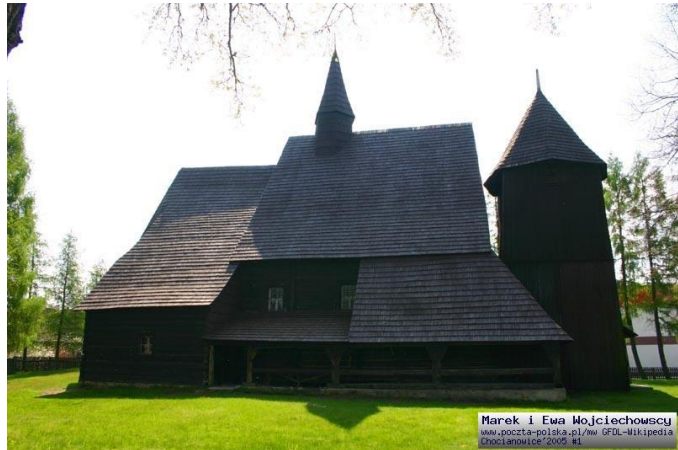
Drewniany kościół parafialny p.w.

Narodzenia NMP z 1662 roku wpisany do rejestru zabytków pod numerem 76/54;