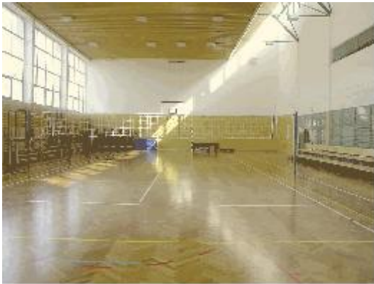
Sala gimnastyczna w Zespole – Gimnazjalno – Szkolno – Przedszkolnym o wymiarach 18m x 36m.