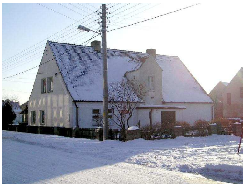
Przedszkole w Chocianowicach