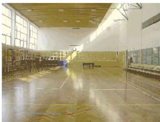
Sala gimnastyczna w Zespole – Gimnazjalno – Szkolno – Przedszkolnym o wymiarach 18m x 36m