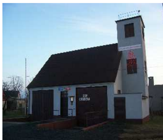
Remiza strażacka w 2008 roku