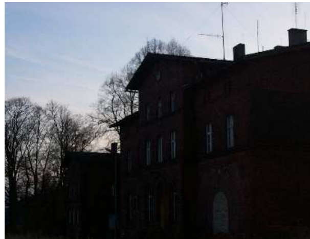
Budynki stacji kolejowej – rok 2008

W budynkach kolejowych w 1905 roku mieszkały 42 osoby. Wszystkie trzy budynki kolejowe istnieją do dzisiaj.