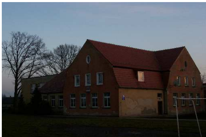
Budynek Szkoły w Chudobie powstał w roku 1857.