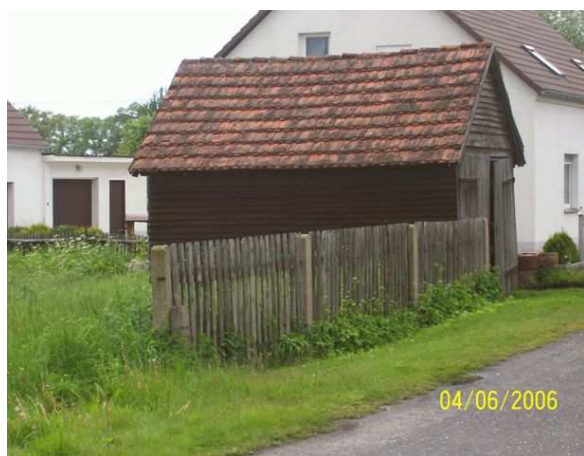
Pierwsza remiza stoi do dziś...