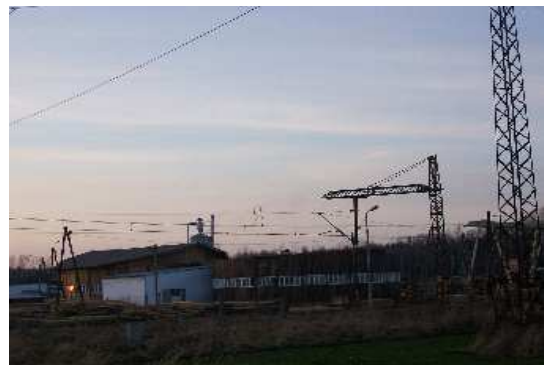
Tartak - zdjęcie z roku 2008

W 1932 roku do Chudoby został przeniesiony z Szumiradu tartak drzewny. Dał on zatrudnienie wielu mieszkańcom. Podczas II Wojny Światowej tartak prawie całkowicie zaprzestał produkcji. Dopiero w 1948 roku nastąpiło ponowne "oficjalne" otwarcie tartaku. Zakład zatrudniał wtedy 140 osób.