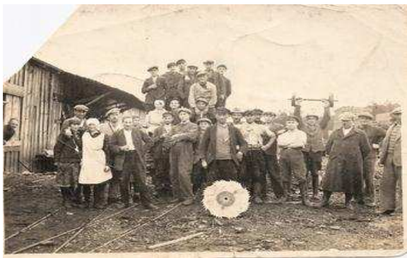
Tartak - zdjęcie z roku 1935

Energia elektryczna pojawiła się w Chudobie już w 1929 roku.