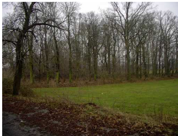
Park dworski połowa XIX wieku