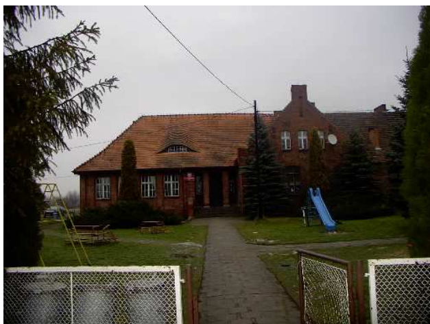
Szkoła w Jasieniu powstała w 1936r.

W Jasieniu znajduje się szkoła podstawowa (zdz. poniżej). Pierwsze wzmianki na temat szkoły pochodzą z roku 1720. Jest tu między innymi wzmianka o opłatach za naukę, która mówi, że „gburowie” z Jasienia winni płacić po dwa krajcary, zagrodnicy po jednym. Opłata ta prawdopodobnie była uposażeniem nauczyciela.