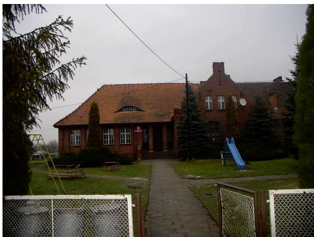
Szkoła w Jasieniu powstała w 1936r.

W Jasieniu znajduje się szkoła podstawowa (zdj. poniżej). Pierwsze wzmianki na temat szkoły pochodzą z roku 1720. Jest tu między innymi wzmianka o opłatach za naukę, która mówi, że „gburowie” z Jasienia winni płacić po dwa krajcary, zagrodnicy po jednym. Opłata ta prawdopodobnie była uposażeniem nauczyciela.