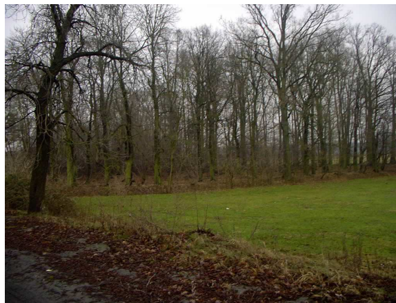
Park dworski połowa XIX wieku