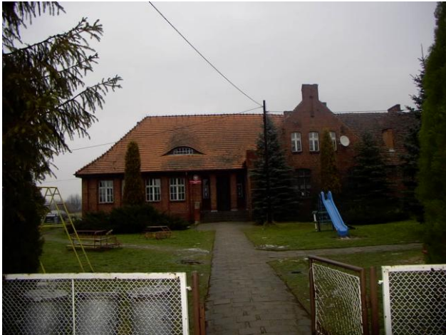
Szkoła w Jasieniu powstała w 1936r.