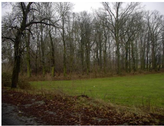
Park dworski połowa XIX wieku